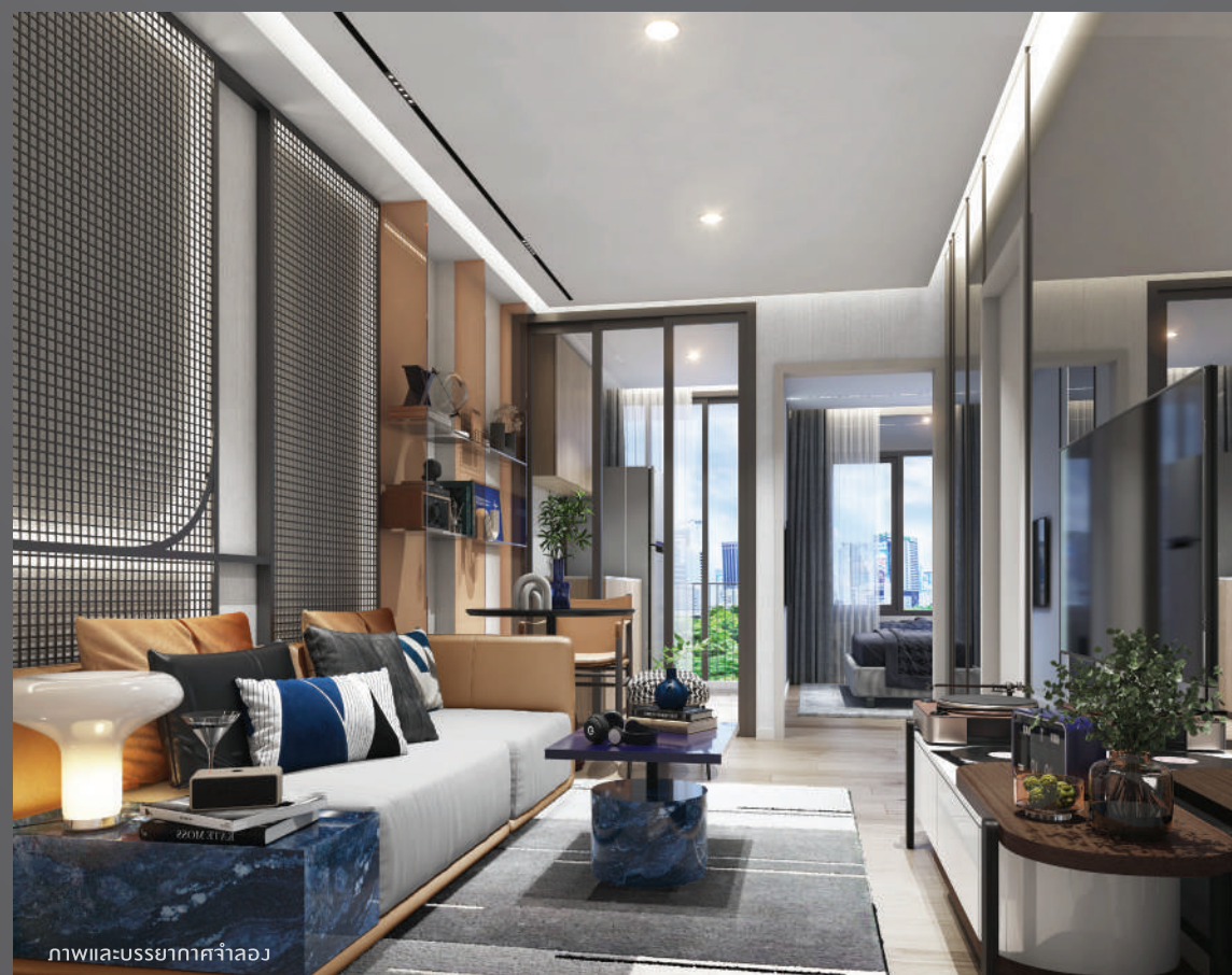
ภาพและบรรยากาศจำลอง

สัมผัสความสูงแห่งการพักผ่อน หันที่ที่ก้าวถึงประตูห้อง จัดวางทุกการใช้ชีวิตได้อย่างลงตัว หวังความเป็นส่วนตัวและฟังก์ชันใช้สอย ห้องนอนใหญ่ และจัดวางแยกห้องครัวอย่างเป็น ลัดส่วนคุ้มค่าทุกตารางเมตร