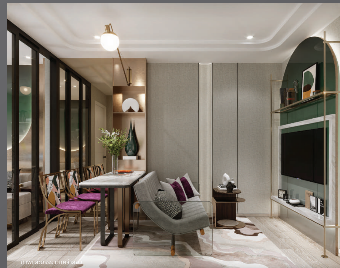
ภาพและบรรยากาศจำลอง