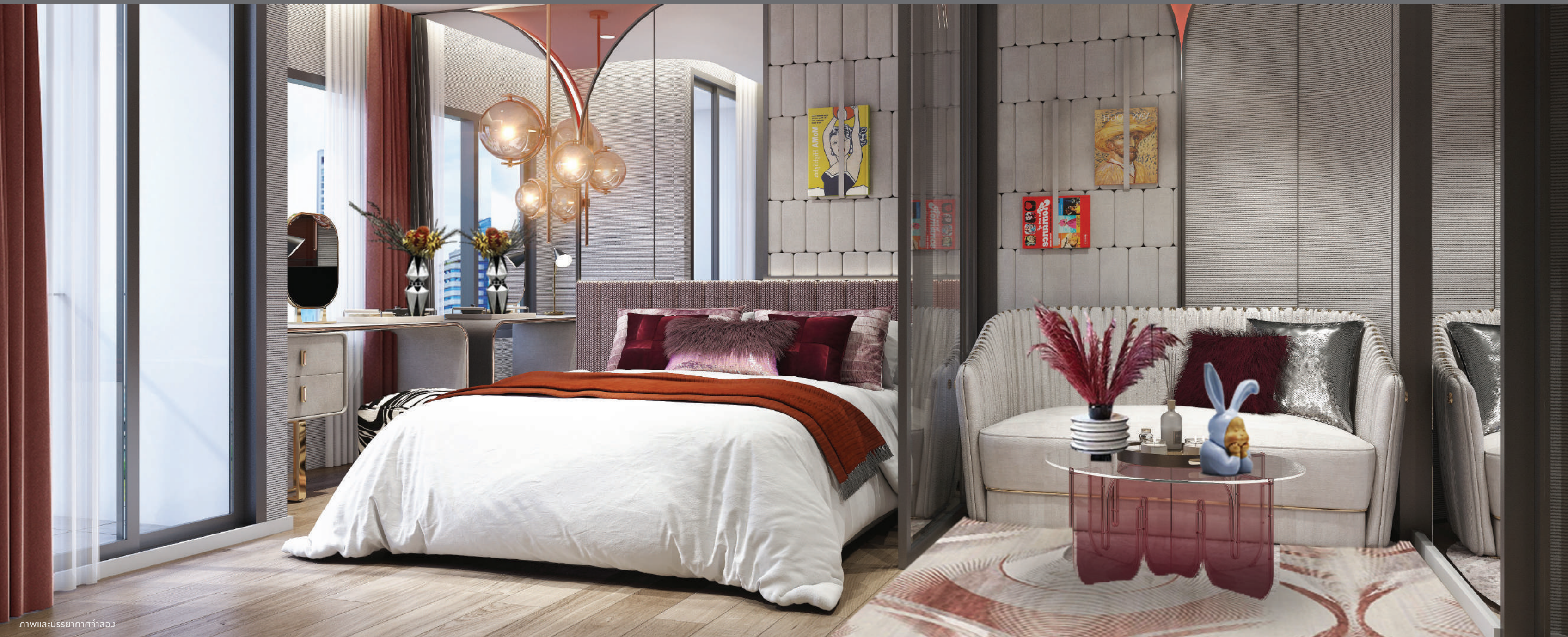
ภาพและบรรยากาศจำลอง