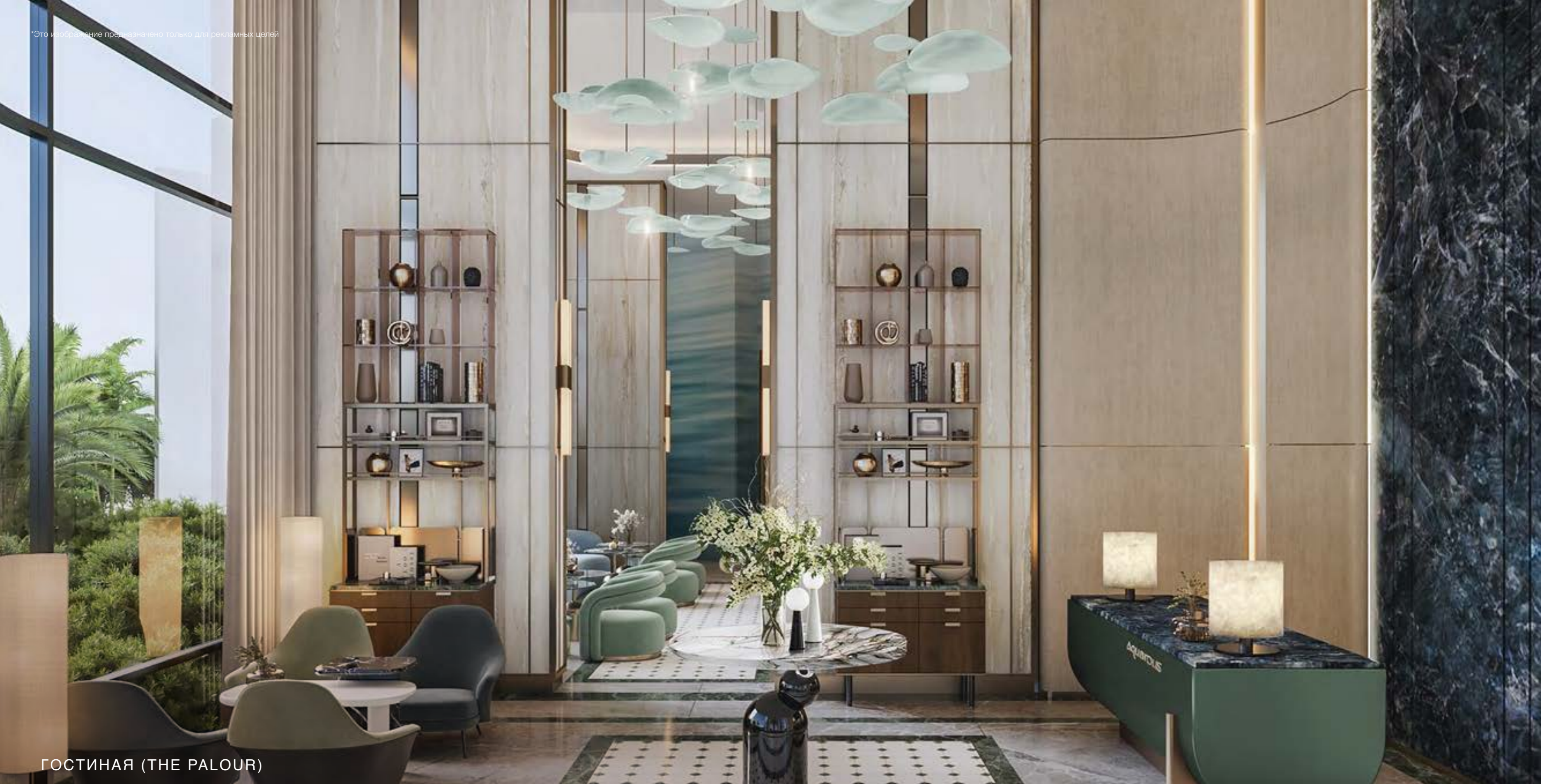
ГОСТИНАЯ (THE PALOUR)