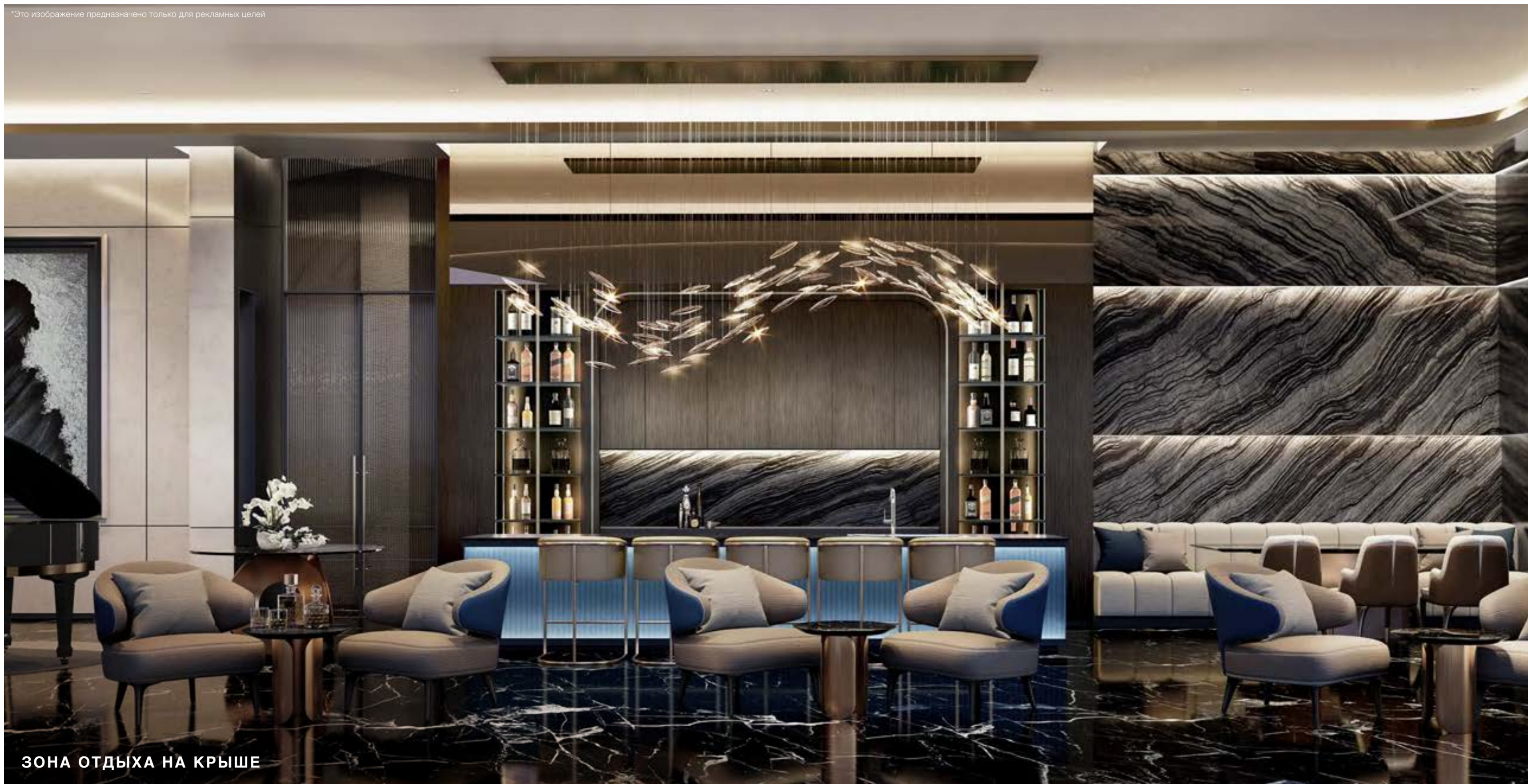
ЗОНА ОТДЫХА НА КРЫШЕ