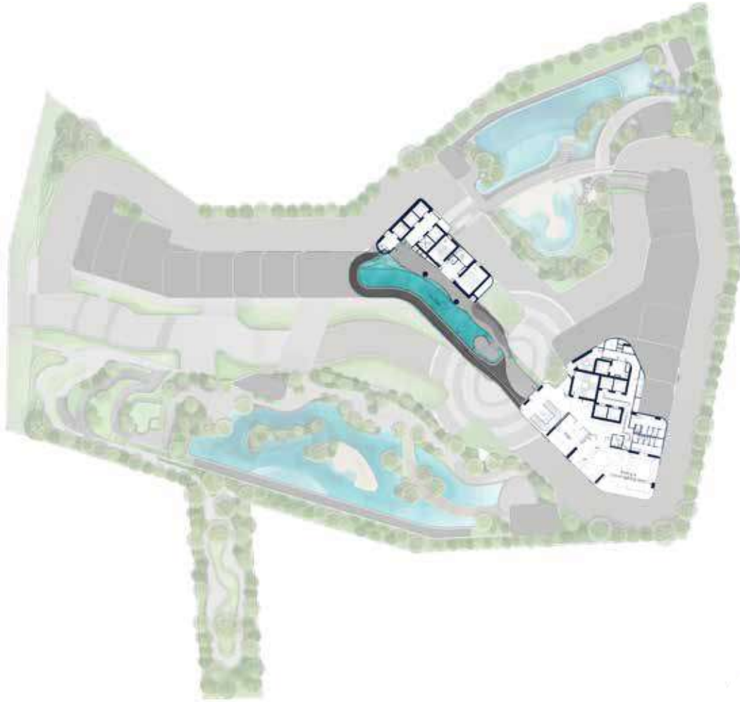
44th FLOOR MASTER PLAN SCALE 1:200

Layout and area of units may change as deemed appropriate without prior notice but will not effect the use and dwelling.