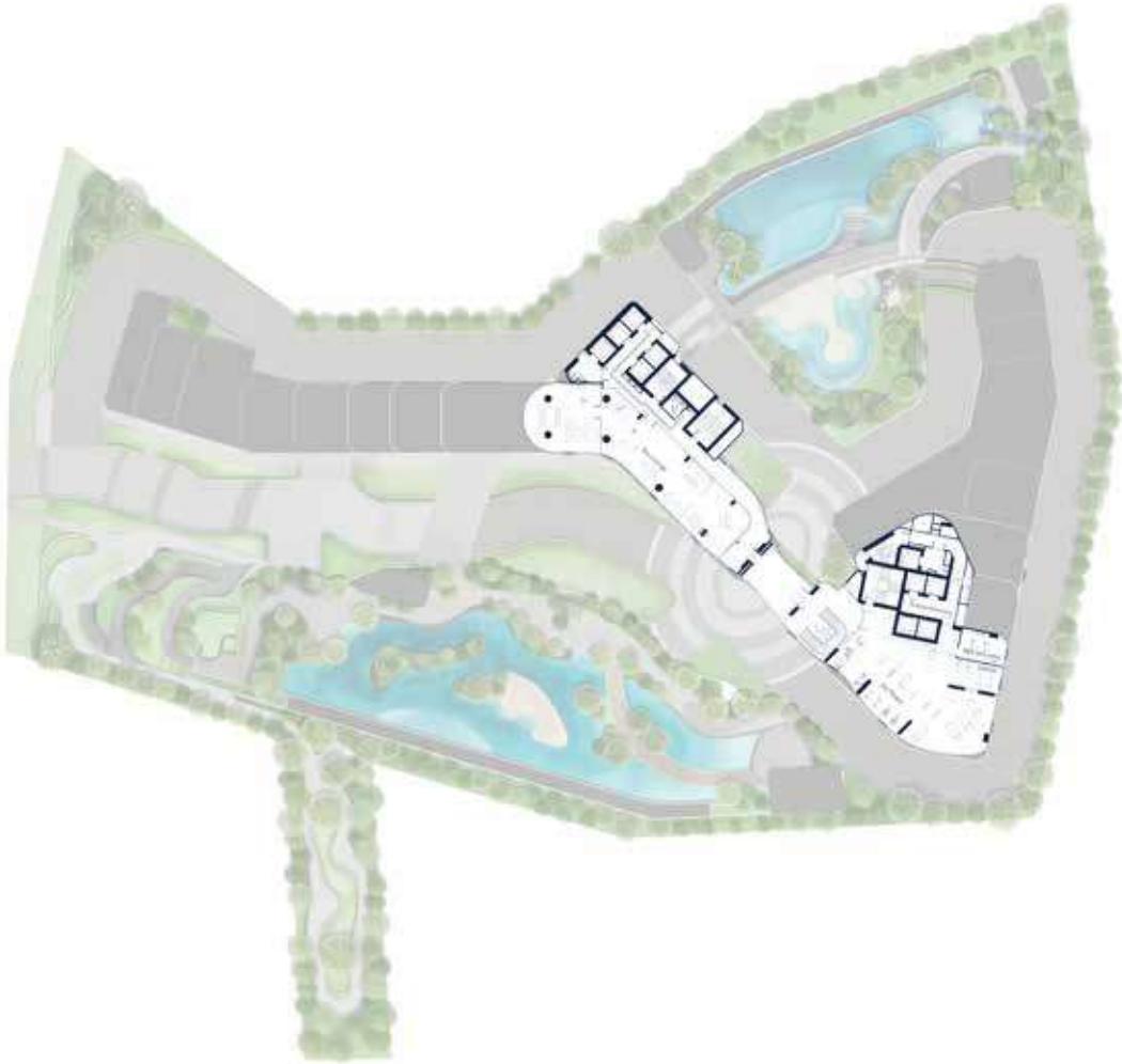
43rd FLOOR MASTER PLAN SCALE 1:200